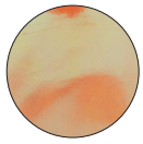
2004 golden yellow